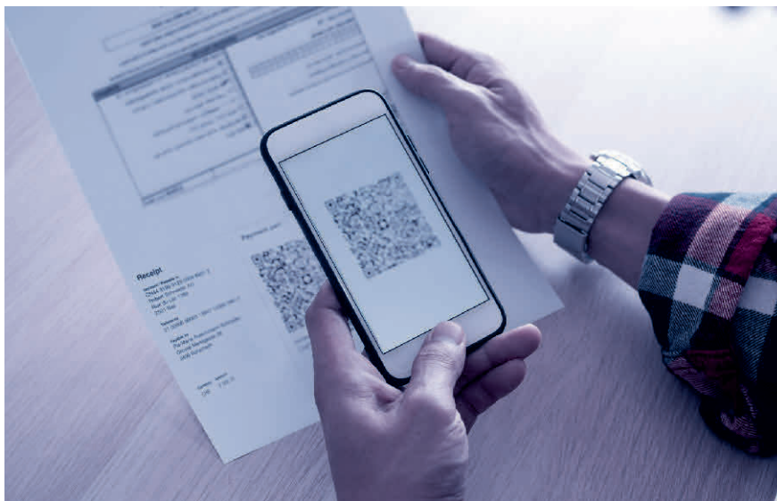
Scannen und fertig: Der QR-Code enthält alle relevanten Rechnungsdaten.

Lesen Sie mehr zum Thema im Blogbeitrag von TREUHAND|SUISSE unter www.treuhandswiss.ch/blog